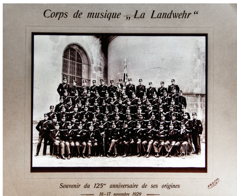
Corps de musique „La Landwehr“