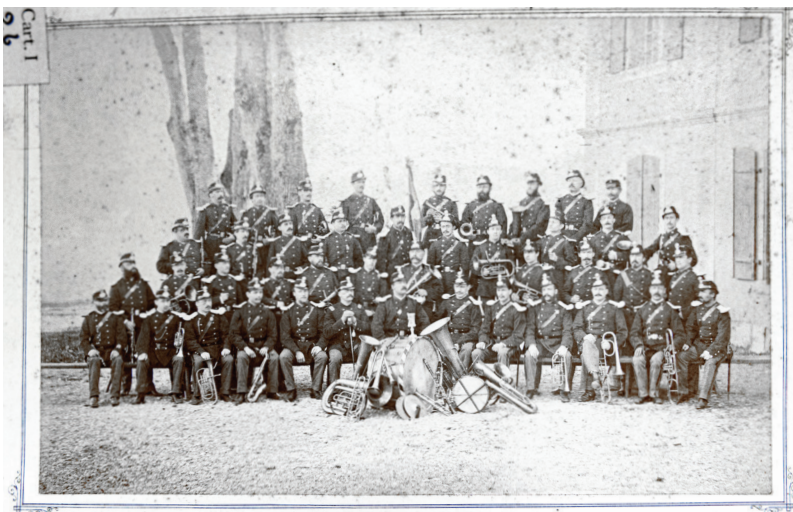
1882. MUSIQUE DE LANDWEHR FRIBOURG

Cette petite guerre continua jusqu'au 9 août 1812, date de la dissolution et licenciement du Corps franc, mais la musique ne fut pas comprise dans cette mesure. D'après l'engagement prévu dans le Règlement de 1809, elle devait avoir un an à servir. Par Décision du 8 juin 1813, le petit Conseil autorisa le réengagement de ces musiciens pour une nouvelle période. Mais on était toujours dans