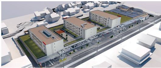
Complexe immobilier Murten Center