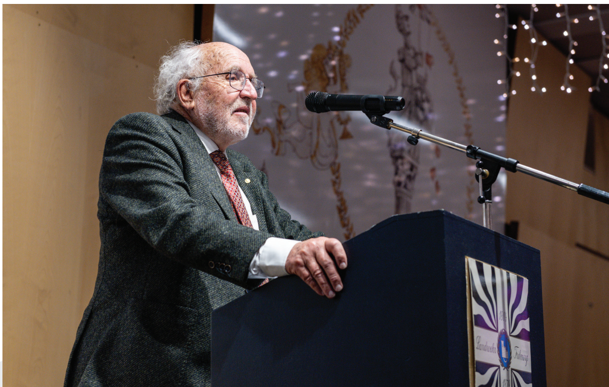
Invité surprise, Michel Mayor, astrophysicien et prix Nobel de physique en 2019, a honoré la Landwehr de sa présence lors de cette 145 ème Soirée des Rois.