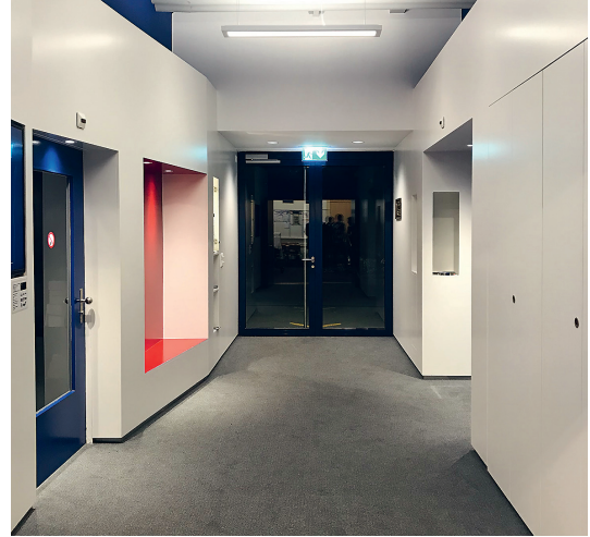
Entrée du local de répétition de la Landwehr

“LA COMPÉTENCE DES LANDWEHRIENS À VOTRE ÉCOUTE”