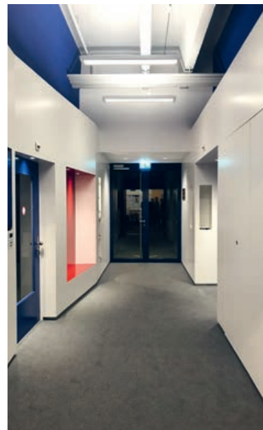
Entrée du local de répétition la Landwehr

“LA COMPÉTENCE DES LANDWEHRIENS À VOTRE ÉCOUTE”